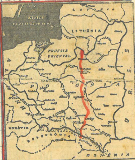
Mapa da Polónia com a indicação da linha Curzon

"A decisão da Comissão foi um grande golpe para a nação polaca. Nunca admitiremos a nova partilha da Polónia feita pelos nossos aliados."