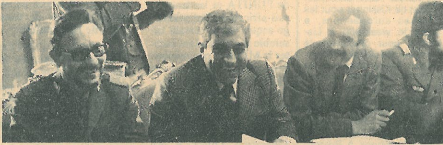
Deuxième à partir de la gauche, Otelo de Carvalho alors qu'il était le chef du Copcon