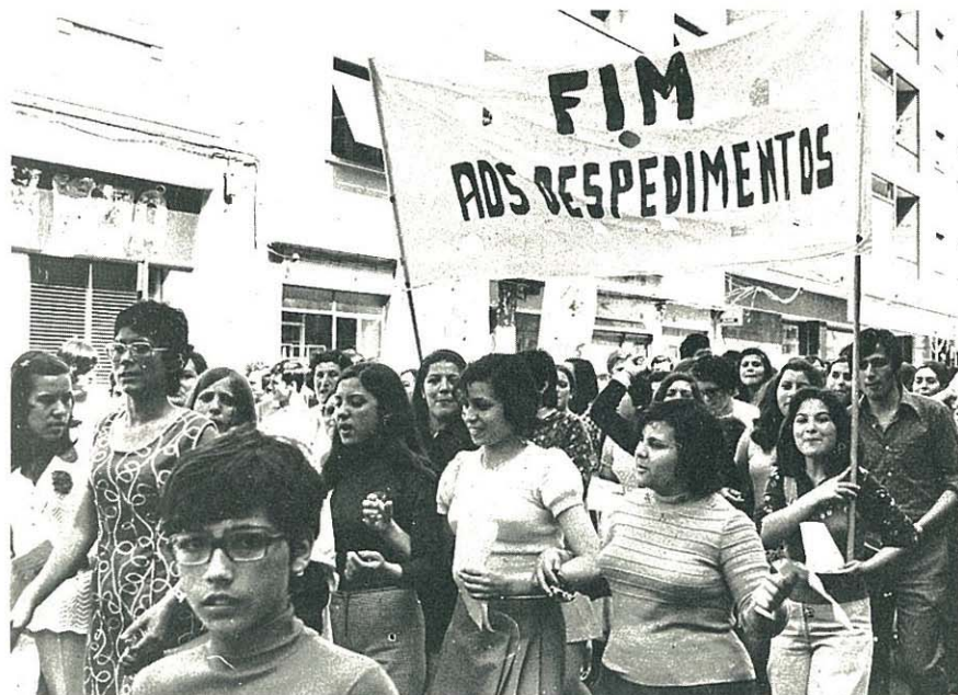
"JULGO QUE O CAPITALISMO ESTÁ A JOGAR NO AMORTECIMENTO DAS LUTAS DOS TRABALHADORES ATRAVÉS DO ESPECTRO DO DESEMPREGO"

V.M. — Vamos tentar aprofundar um pouco mais a questão colonial. Ainda agora falámos da guerra colonial como factor decisivo na evolução recente do problema político português. Mas como estamos a falar preponderadamente do que é e do que vai ser o capitalismo português, vejamos relativamente a África o que foi e o que irá ser o comportamento desse capitalismo. Dá-me ideia que, da África, o capitalismo português aproveitou apenas, como V. aliás já referiu, resultados de uma superexploração da mão-de-obra africana, fundamentalmente no sector agrícola e no aproveitamento de certas matérias-primas e estas muito rudimentares relativamente a um grande desenvolvimento industrial. Estamos na situação de sermos o único país colonialista cujo povo não prosperou com a exploração colonial. Apesar de termos tido um império colonial tão vasto