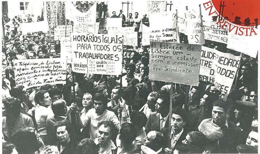
“ESTÁ A HAVER UM AVANÇO REAL NA LUTA DE CLASSES”

seja minimamente afectado pela independência daquela colónia. No que respeita a Moçambique os seus interesses eram relativamente reduzidos.