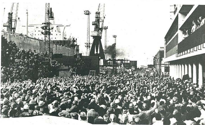
“OS TRABALHADORES TÊM CONDUZIDO LUTAS EXEMPLARES DE CONTEÚDO POLÍTICO”

grandes grupos industriais ou tem eles próprios fortes interesses industriais. Através deste sistema, um pequeno número de grupos financeiros e industriais, quer de base bancária quer de base industrial, controlam de facto, não direi a totalidade mas uma muito larga parcela das actividades económicas em Portugal. E